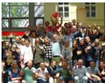
L'ÉQUIPE MARIAGEWEEK EN CONFÉRENCE EN AUTRICHE